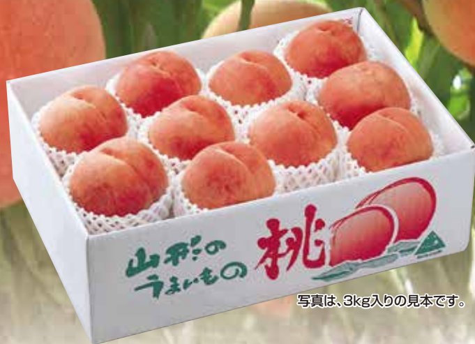
写真は、3kg入りの見本です。