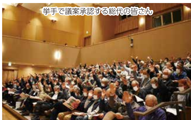
挙手で議案承認する総代の皆さん