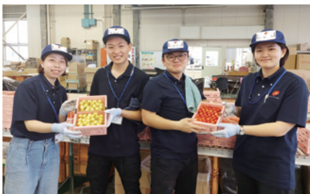
東京シティ青果の4名