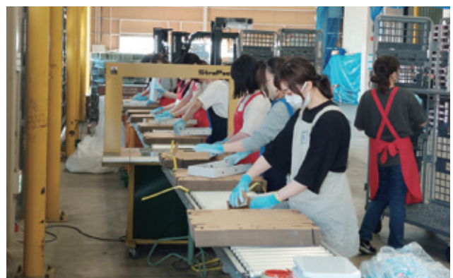
取引会社の皆さん