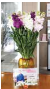
飾花事業…駅や空港に花卉部会員のお花を飾っています。

3月29日(金)に東根市農協野菜特産花卉協議会の総会が開催され、令和5年度の事業報告および令和6年度の事業計画方針の承認が行われました。 令和5年度を振り返ると、コロナ禍が明け、様々な視察研修や講習会が開催され、充実した活動を行うことができました。 今年度も引き続き、栽培技術の向上や農業所得増大を目指すとともに、東根の野菜・花卉を盛り上げる活動をしてまいります。新規協議会員も募集中です!