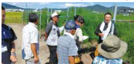
夏季研修会の様子 TACも一緒に、アスパラガスの視察へ!

3月29日(金)に東根市農協野菜特産花卉協議会の総会が開催され、令和5年度の事業報告および令和6年度の事業計画方針の承認が行われました。 令和5年度を振り返ると、コロナ禍が明け、様々な視察研修や講習会が開催され、充実した活動を行うことができました。 今年度も引き続き、栽培技術の向上や農業所得増大を目指すとともに、東根の野菜・花卉を盛り上げる活動をしてまいります。新規協議会員も募集中です!