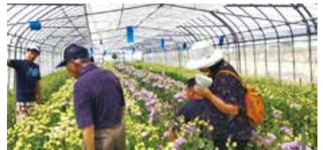
花卉部会 視察研修の様子 トルコキキョウの視察へ行きました!